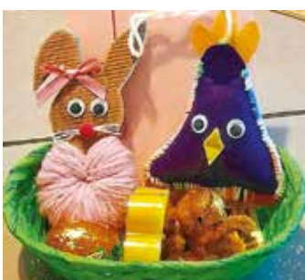
Ostergrüße der OG Kreischau / Schokohasen der OG TG-Nord / Schmetterlinge aus Mehderitzsch

Das Miteinander-Füreinander ist auch in Corona-Zeiten allen ein Herzensanliegen.