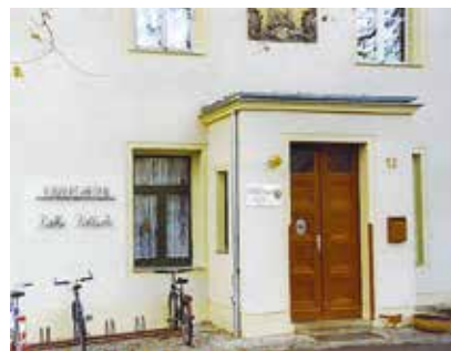
Alte Käthe – Leipziger Wall

Seit dem 1. April 1996 gehört die integrative Kindertagesstätte „Käthe Kollwitz“ zur Volkssolidarität in Torgau. Mit der Übernahme aus