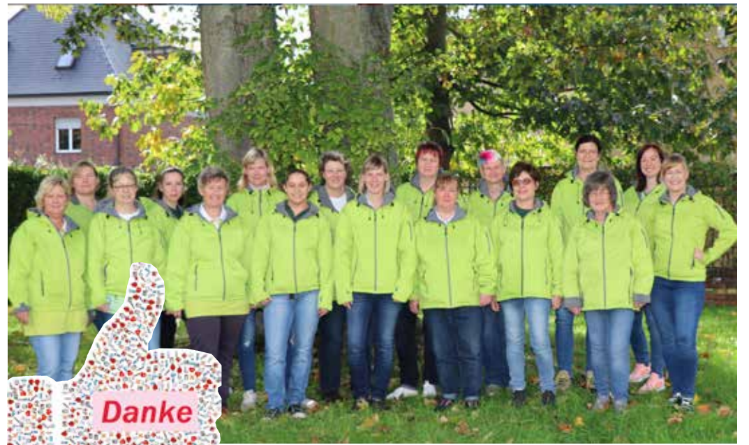
Die nominierten Pflegeteams der Volkssolidarität.

Auch wenn es kein Sieg geworden ist, sind wir glücklich über jede Stimme und sagen DANKESCHÖN für die Unterstützung.