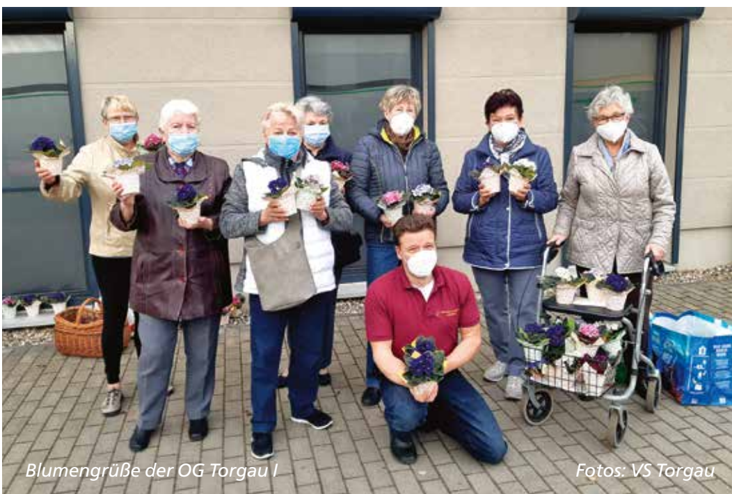
Blumengrüße der OG Torgau I