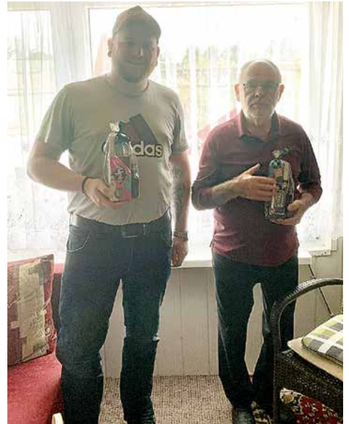
Männertags-Aktion der OG 15

Anlässlich des diesjährigen Männertages ließ sich der Vorstand der Ortsgruppe 15 eine kleine Überraschung für alle männlichen OG-Mitglieder einfallen. Coronakon-