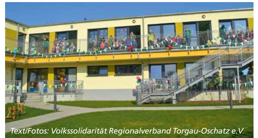
Text/Fotos: Volkssolidarität Regionalverband Torgau-Oschatz e.V.

Zum heutigen Team gehören 19 Erzieher*innen inkl. Einrichtungsleitung sowie ein Haustechniker und eine hauswirtschaftliche Mitarbeiterin. Zudem beschäftigen wir zurzeit zusätzlich Studenten der Sozialen Arbeit im Rahmen ihrer Praxisphase und bieten Plätze für das freiwillige soziale Jahr und den Bundesfreiwilligendienst an.